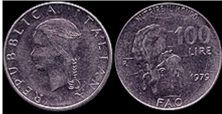
100 ლირა, აკმონიტალი.